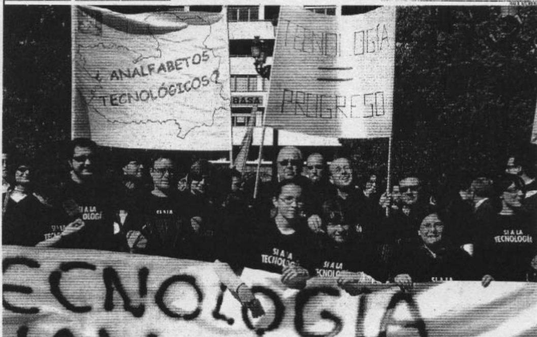
CERCA DE UN CENTENAR DE DOCENTES SE CONCENTRAN EN EL ALTOZANO

El Comité Federal del PSOE aprobó ayer el manifiesto autonómico en el que se recoge la reivindicación de nuestra región de participar en los órganos de gestión del agua, y en el que en materia de trasvases se reconoce el carácter preferente en el uso del agua para la cuenca cedente.—PÁGINA 28—